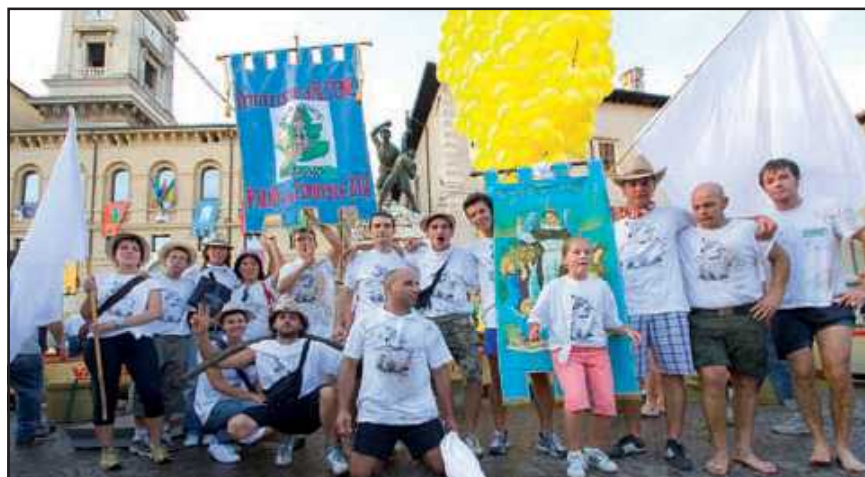
La contrada vincitrice "Drio Piassa"