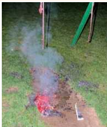
Altalena bruciata da alcuni vandali

In quasi tutti i parchi del paese si sono moltiplicati quest'anno gli atti vandalici a danno di altalene, giostre, scivoli e alberi. In alcuni casi i responsabili sono stati segnalati e denunciati, in altri casi non sono stati individuati perchè i fatti si sono svolti di notte. L'appello dell'amministrazione comunale è di segnalare qualsiasi atto vandalico telefonando ai vigili o ai carabinieri. IL VERDE PUBBLICO È UN BENE DI TUTTI E DEVE ESSERE RISPETTATO!