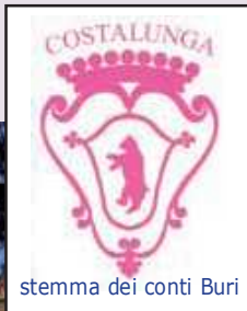
stemmi dei conti Buri