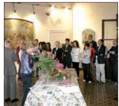
Momento dell'inaugurazione della mostra

Arrivederci all'anno prossimo con una nuova grande mostra su un altro importante pittore montefortiano...