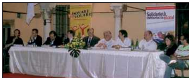
Momento del meeting "Giovani e solidarietà: responsabilità giovanile nel sociale".

La 3 a Festa Provinciale Giovani si è conclusa a notte fonda con successo, questo con la soddisfazione di tutto il Gruppo Giovani Veronese e in particolare del Consiglio Direttivo dell'Avis di Monteforte, che tanto si è impegnato per la buona riuscita della manifestazione.