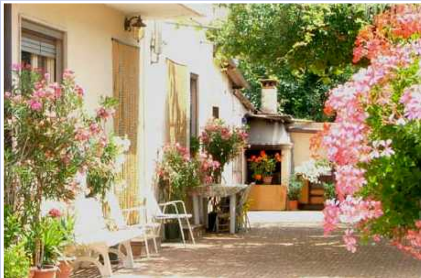
Il balcone di Emilio Molinarolo, il vincitore