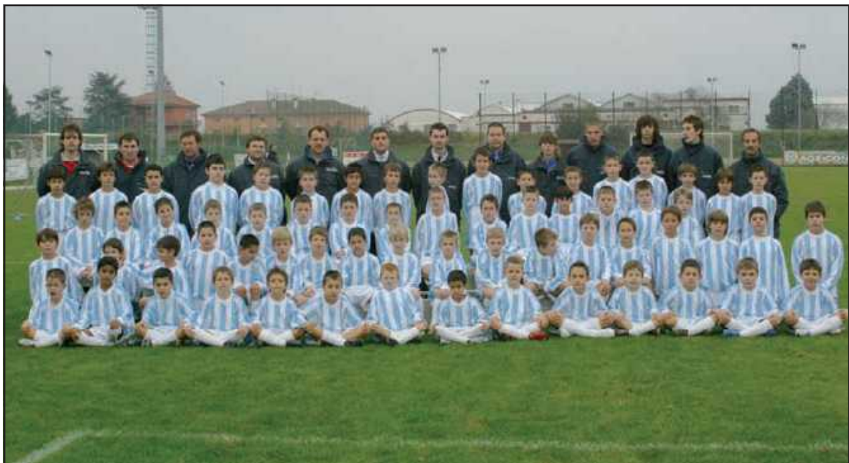
Scuola Calcio Real Monteforte 2006 - 2007